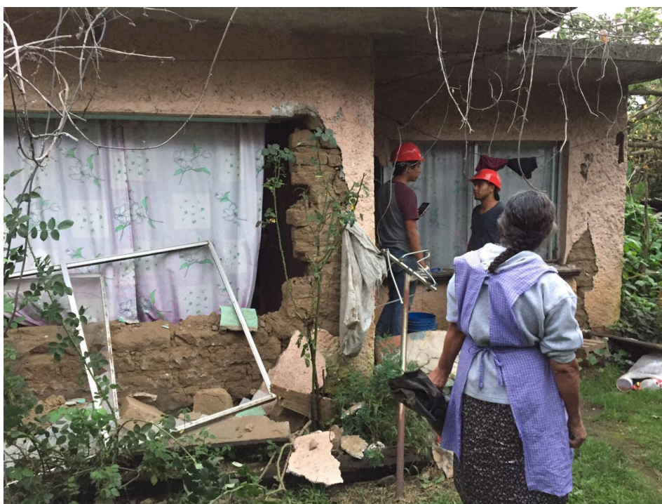
Figura 2. Daños en viviendas vernáculas durante el I9s modificadas con nuevos materiales en Tetela del Volcán

Esta perspectiva sobre la pobreza se evidencia en Tetela del Volcán por las aspiraciones de migrar hacia las ciudades cercanas, para acceder a trabajos urbanos y a los servicios educativos que son limitados en la comunidad. También se expresa en la transformación de las viviendas tradicionales, pues el adobe (arcilla), material principal de la arquitectura vernácula de la región se vio desplazado por materiales como concreto, block y cemento. Ante la necesidad de mostrar una imagen de modernidad, la falta de apropiación a nuevos sistemas constructivos, la falta de una normatividad de construcción y en otros casos la ampliación de las viviendas por el incremento de las familias aumentó el riesgo debido a la falta de compatibilidad de materiales usados, “Durante el recorrido de la comunidad fue común encontrar primeros pisos de adobe y segundos de concreto” (Notas de campo personales).