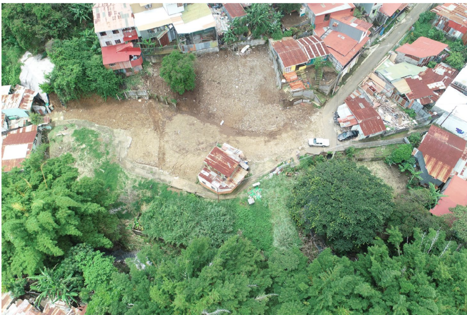
Figura 3. Fotografía aérea de Barrio Fátima

En el primer semestre de 2019 se ejecutó la demolición de las viviendas cuyos dueños ya habían sido trasladados a las urbanizaciones antes mencionadas. No solo se demolieron las casas sino que también se removieron los escombros del lugar como se muestra en la Figura 3, en la cual se aprecia el sitio tal y como quedó después de la limpieza. Se puede apreciar el río en la esquina inferior izquierda de la Figura 3.