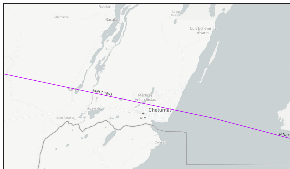
Figura 2. Paso de Janet por el sur de Quintana Roo