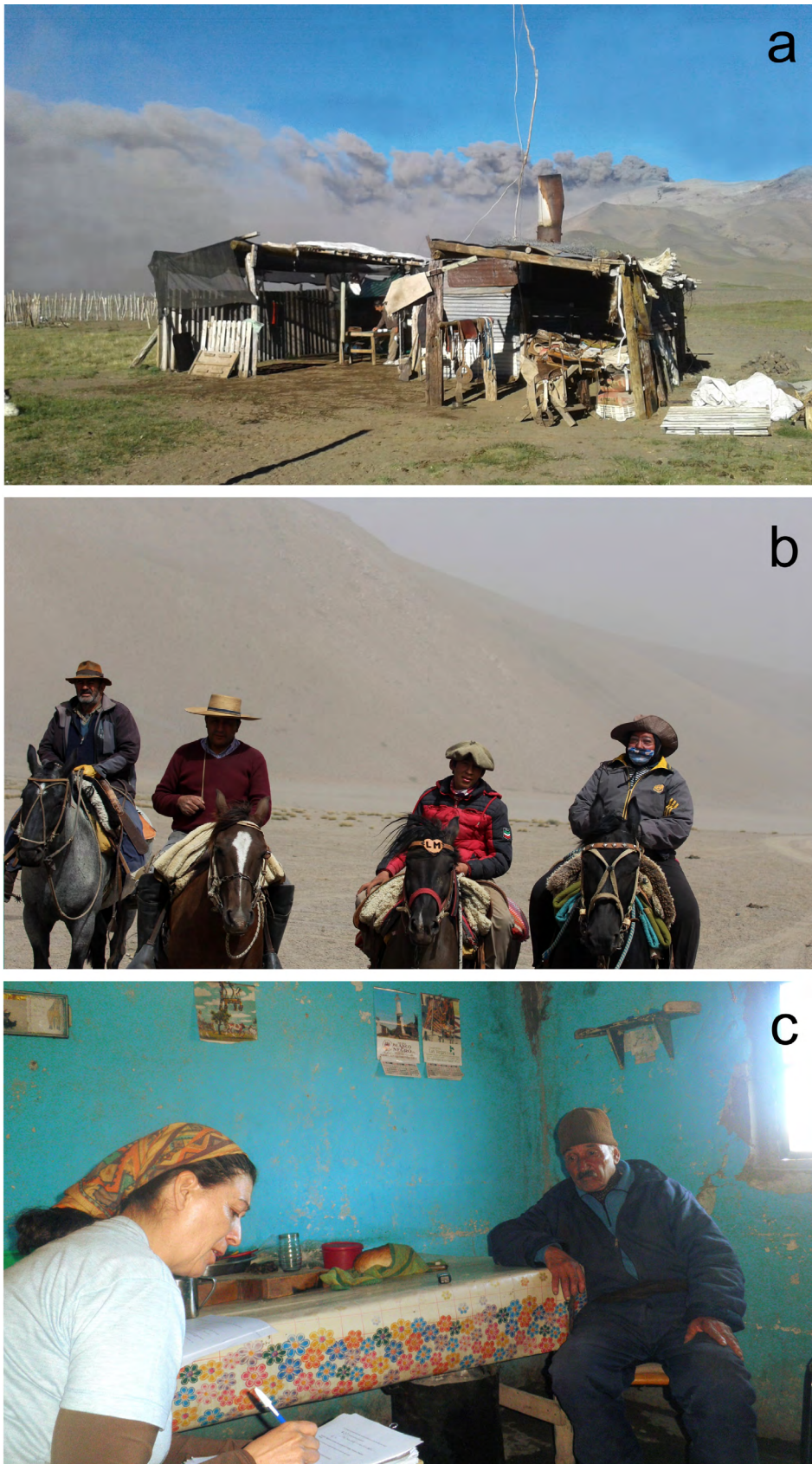
Figura 3. La comunidad rural expuesta