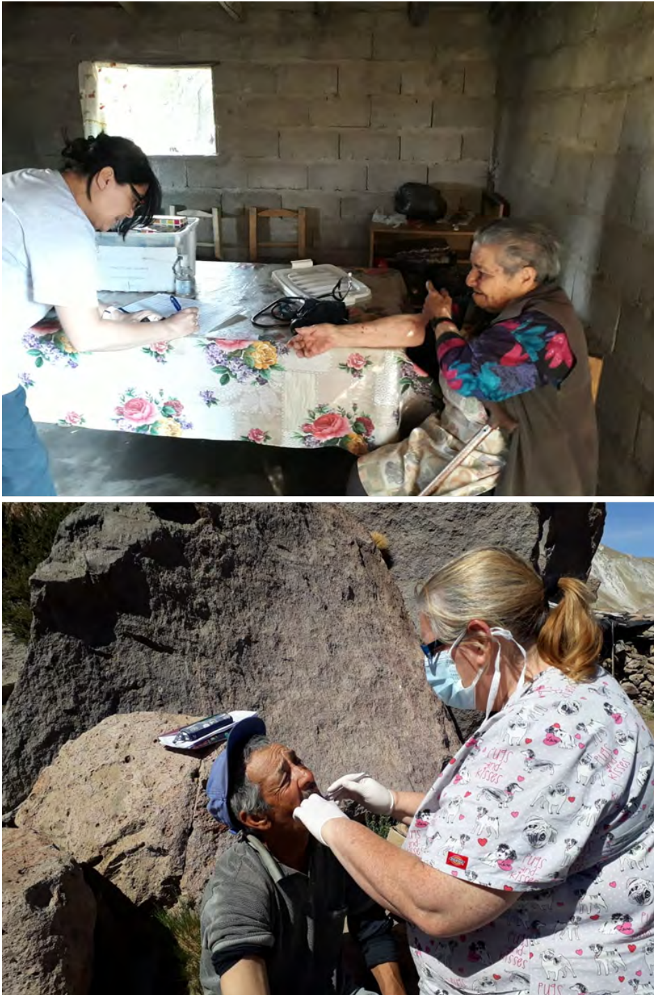
Figura 4. Atención médica en puestos de veranada situados en las cercanías del CVPP

Las fricciones en la articulación se tradujeron en la manifestación de otros dos nodos problemáticos vinculados con la asistencia y la comunicación . La asistencia es una pieza clave en la respuesta ante cualquier emergencia o crisis desatada por un evento volcánico y está sumamente ligada a la coordinación entre los actores e instituciones y, por supuesto, a la posibilidad de contar con planes de contingencia claros y accesibles. Si no hay acuerdos preestablecidos y diálogos, difícilmente se puede asistir bien a la población que así lo requiera. Si bien los impactos reportados para esta erupción fueron leves, las entrevistas nos permitieron observar que existieron algunas problemáticas que demandaban presencia institucional en el territorio.