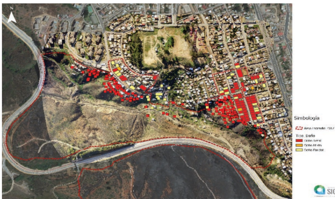
Figura 5. Mapa Satelital viviendas afectadas por incendio de Puertas Negras, Valparaíso, Chile

La vinculación entre medio construido y medio natural forestal ha dejado expuesto al territorio a diversos incendios forestales, de los cuales el mayor aconteció el 2 de enero de 2017, declarándose 'Zona de Catástrofe' a una parte importante del polígono, considerando viviendas emplazadas en asentamientos informales y consolidadas, afectando a más de un centenar de viviendas como se grafica en la Figura 5. Lo anterior dejó en evidencia la vulnerabilidad del territorio frente a desastres socionaturales y ha delatado cómo la falta de mitigación acentúa el riesgo de ocurrencia de nuevos eventos similares.