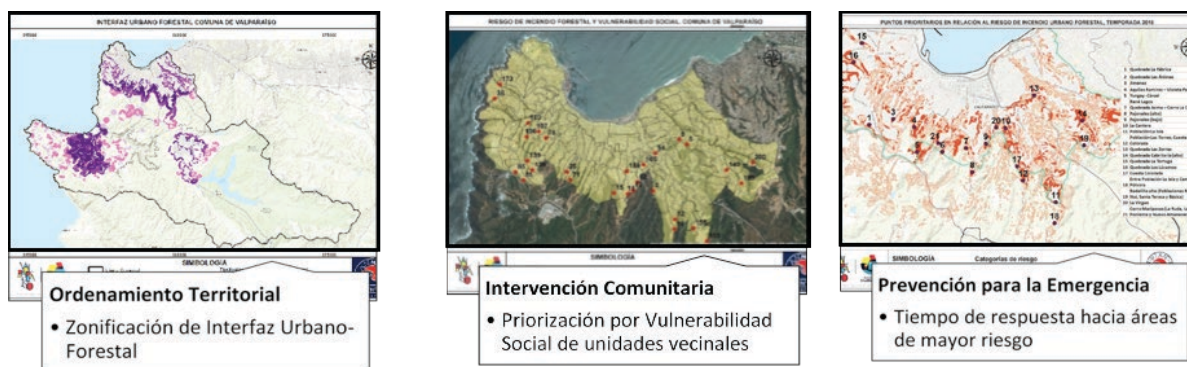
Figura 2. Tres ejes investigados en el Plan Maestro para la Gestión del Riesgo de Incendios

Los resultados del estudio previo al plan maestro permitieron constatar que el sector de Puertas Negras presenta alta vulnerabilidad en los tres ejes investigados (ordenamiento, comunitaria, y prevención), posicionándolo como un punto importante para trabajar de manera coordinada entre las instituciones y las comunidades con el fin de disminuir los riesgos que presenta la comuna.