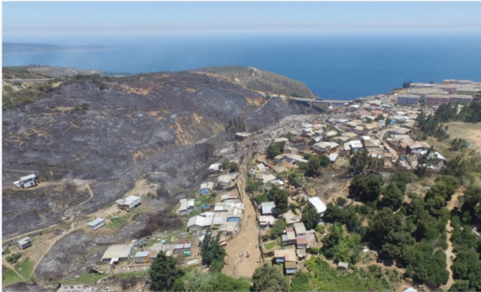
Figura 3. Fotografía Aérea Quebrada la Fábrica tras Incendio de Enero del 2017

antes de la catástrofe, llegando a casi a un 0% post-incendio, lo cual refleja la magnitud del daño (Bellec & Draghi, 2017). Es relevante señalar, que la quebrada La Fábrica posee una alta densidad de viviendas en conjunto con la presencia de vegetación, lo cual indica un riesgo para la población dado que no se realiza un manejo de la carga combustible que se produce entre los medios urbano-forestales.